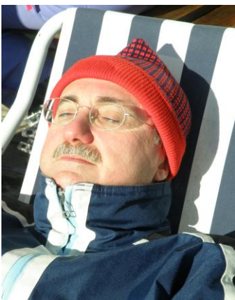
Gli apripista... (tutto il giorno così!)

Grazie al Centro per questa possibilità e Buon 2009 a tutti !